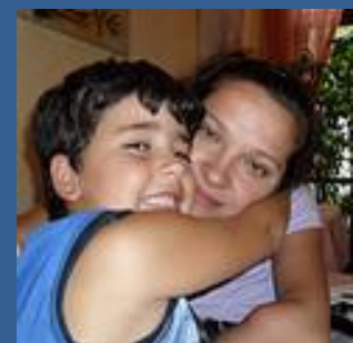
Sila en Trevor

Wat je nog meer wilt vertellen: Ik hoop dat we voor uw kind(eren) leuke dingen gaan regelen en dat u positief bent over de nieuwe AC!